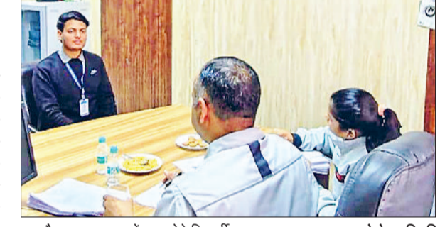
नारनौल। साक्षात्कार में भाग लेते विद्यार्थी।