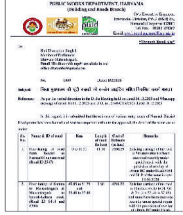
महेंद्रगढ़। सांसद के निर्देश के बाद भेजा गई एस्टीमेट रिपोर्ट।