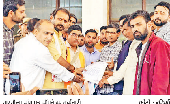
नारनौल। मांग पत्र सौंपते हुए कर्मचारी।

जब विधानसभा चुनाव थे तो भाजपा पार्टी ने वायदा किया था कि सत्ता में आने पर पांच साल पूरा कर चुके एचकेआरएनएल कर्मचारियों को जाँब सिक्वोरिटी दी जाएगी। चुनाव भी जीता और जाँब सिक्वोरिटी का वायदा पूरा करने के लिए एक पोर्टल भी लांच किया। इस पोर्टल में जब एचकेआरएनएल कर्मचारी आवेदन करते हैं तो डीआईटीएस यानि डिस्ट्रिक्ट इन्फॉर्मेशन टेक्नोलॉजी सोसायटी का नहीं दिखाई देता। ना ही ऐसे कर्मचारी के पास ओटीपी आ रहे है। इसी विरोध में इन