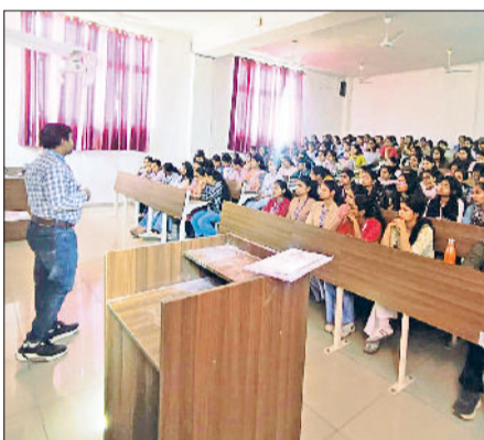
महेन्द्रगढ़। विद्यार्थियों को संबोधित करते हुए।