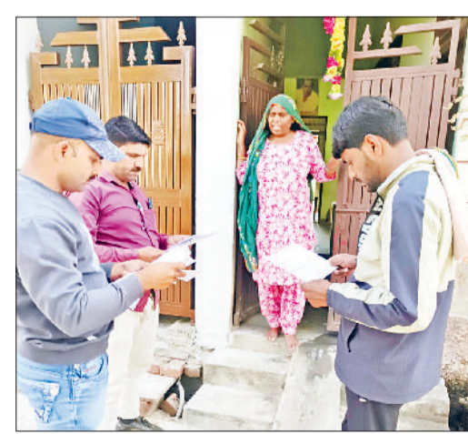
नारनौल। घर-घर जाकर उपभोक्ताओं से बकाया शुल्क भरवाने का काम करती विभागीय टीम।

अब पेयजल एवं सीवर उपभोक्ताओं को अपनी संपत्ति खरीदते या बेचते समय जन स्वास्थ्य अभियांत्रिकी विभाग से 'नो ड्यूज' (अनापत्ति प्रमाण पत्र) लेना अनिवार्य किया जा सकता है। इस संबंध में जन स्वास्थ्य अभियांत्रिकी विभाग, उपमंडल नंबर-1 नारनौल के उपमंडल अभियंता मुकेश शर्मा ने शहर के तहसीलदार को पत्र लिखकर अनुरोध किया है। उपमंडल अभियंता ने बताया कि जन स्वास्थ्य अभियांत्रिकी विभाग, मंडल नंबर-1 नारनौल के उपभोक्ताओं पर लगभग 17 करोड़ रुपये का जल एवं सीवर शुल्क बकाया है। उन्होंने बताया कि विभाग के संज्ञान में आया है कि कई उपभोक्ता विभाग का बकाया चुकाए बिना ही अपनी संपत्तियां बेच देते हैं, जिससे विभाग को निरंतर राजस्व हानि हो रही