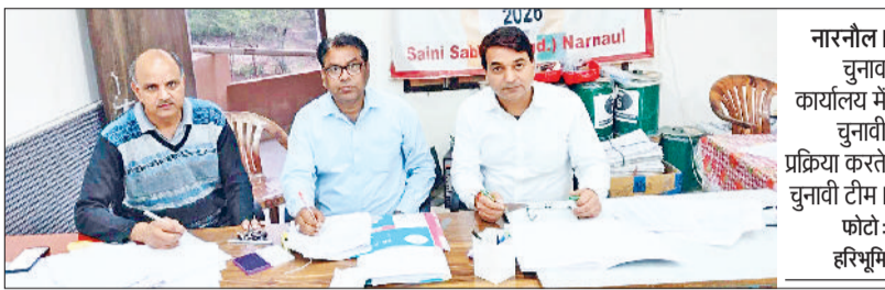
नारनौल। चुनाव कार्यालय में चुनावी प्रक्रिया करते चुनावी टीम।