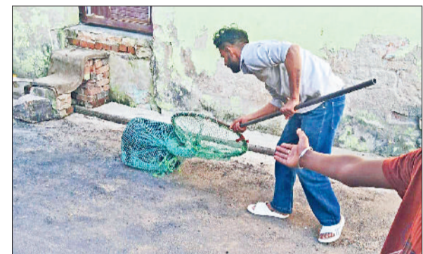
महेन्द्रगढ़। शहर में कुत्ते पकड़ते एजेंसी कर्मचारी।

गए हैं। जिन गाड़ियों के ईसीएम बरामद किए हैं, ये गाड़ियां राजस्थान व जम्मू कश्मीर की थीं। पुलिस ने अंतरराज्यीय वाहन चोर गिरोह का पर्दाफाश किया है।