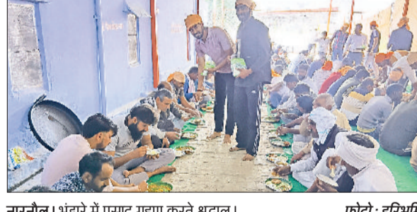
नारनौल। भंडारे में प्रसाद ग्रहण करते श्रद्धालु।

नारनौल। गांव नांगलकाठा में बाबा निहलाईनाथ की पुण्य स्मृति में फाल्गुन नवमी को मेले का आयोजन किया गया। इससे पूर्व रात्रि को जागरण आयोजित किया गया। जिसमें सुरेन्द्र एंड पार्टी गोद बलाहा ने रातभर मजनों से बाबा का गुणगान किया। उन्होंने मजनों की शुरुआत गणेश वंदना से की और गजानंद महाराज धारो कीर्तन की तैयारी नामक सुंदर मजन सुनाया। इसके बाद बाबा निहलाईनाथ से झोली भरवा ले मजन सुनाया, जिस पर श्रोतागण झूमने लगे। इस टीम ने नांगलकाठा वाला हमारा रखवाला व तेरी दया त जिनगी कटरी मौज से सहित अनेक मजन सुनाकर माहौल को भक्तिमय बनाए रखा। वहीं बुधवार प्रातःकाल को बाबा निहलाईनाथ के मंदिर में खीर, जलेबी प्रसाद के रूप में भंडारा तैयार किया गया। प्रातः पूजा अर्चना करने उपरांत श्रद्धालुओं में प्रसाद वितरित किया गया।